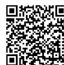
健康ガイド大人編

※詳細については、健診日近くに「広報しかおい」などでお知らせします。 右のQRコードより、健康ガイドをご覧くださいませ。 健康ガイドの冊子は、トリムセンターで配布しています。