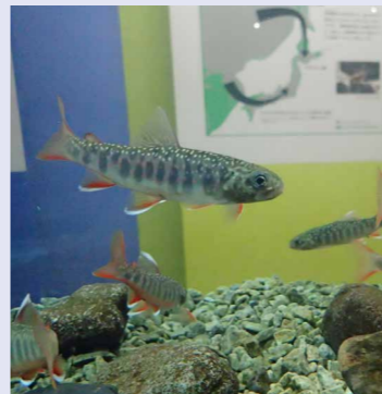
ミヤベイワナ生体展示 孵化して1年の幼魚を飼育中

然別湖では5月下旬からグレートフィッシングが開催されます(運営:NPO北海道トラウトフィッシング協会)。普段は禁漁の湖で、遊漁料を支払い、細やかなルールを守ることで釣りをする事ができます。1年間で50日間だけ、1日50人限定の特別解禁です。その対象魚には然別湖にしかないミヤベイワナも含まれます。生息地が北海道の天然記念物に指定されている貴重な魚ですが、孵化事業や禁漁などで守られ、資源調査の一環として釣りに活用できるようになりました。