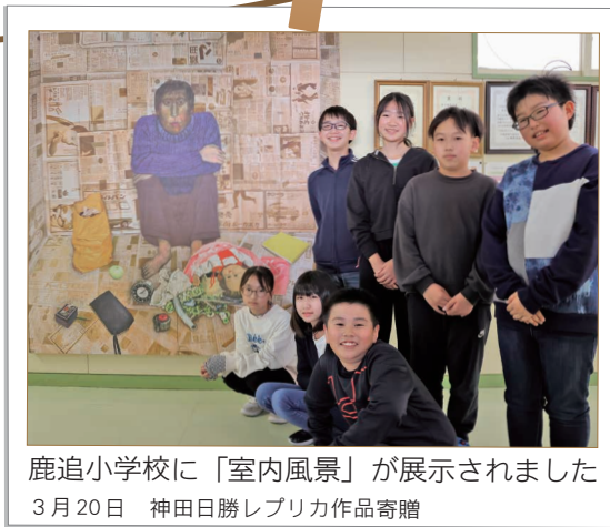
鹿追小学校に「室内風景」が展示されました 3月20日 神田日勝レプリカ作品寄贈