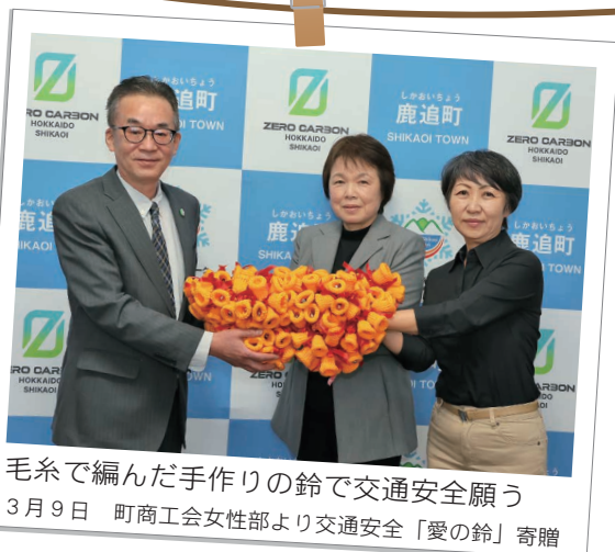
毛糸で編んだ手作りの鈴で交通安全願う 3月9日 町商工会女性部より交通安全「愛の鈴」寄贈