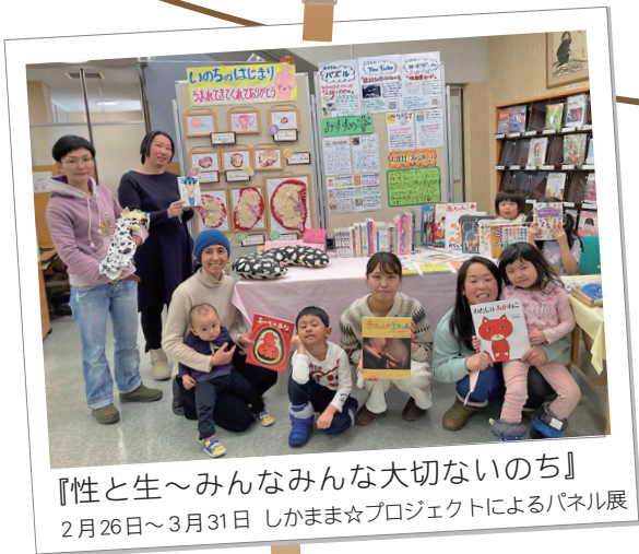
『性と生～みんなみんな大切ないのち』 2月26日～3月31日 しかまま☆プロジェクトによるパネル展