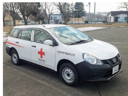
災害発生時における救援物資の運搬や避難所間の情報伝達などに活用させていただきます。