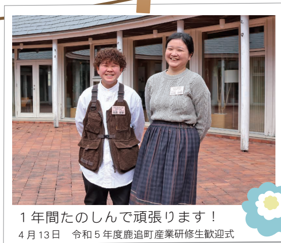
1年間たのしんで頑張ります！ 4月13日 令和5年度鹿追町産業研修生歓迎式