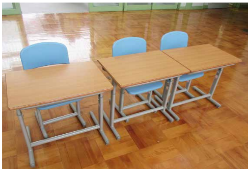
ピカピカの机と椅子で楽しく勉強に取り組んでください!