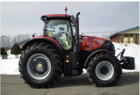
今回町営牧場に導入されたトラクター