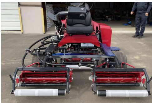
綺麗に整備されたパークゴルフ場にぜひお越しください