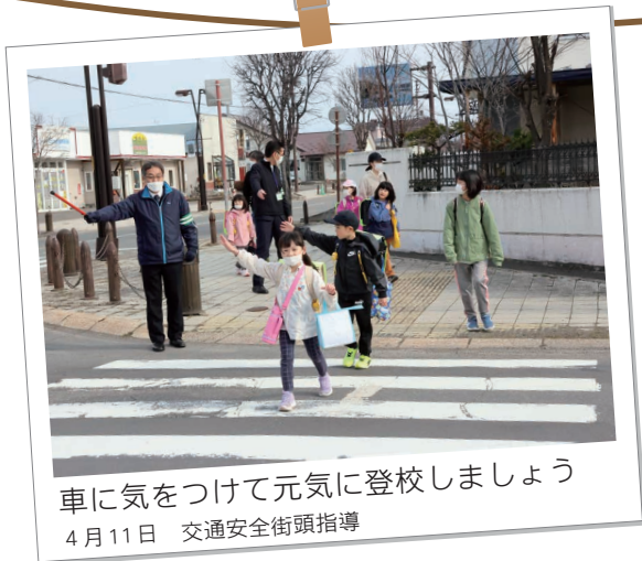
車に気をつけて元気に登校しましょう 4月11日 交通安全街頭指導