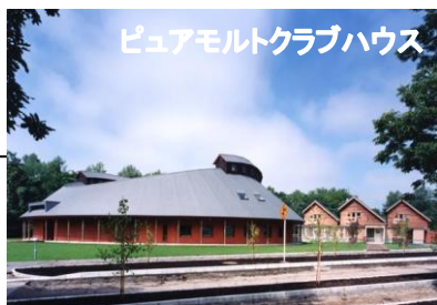
ピュアモルトクラブハウス