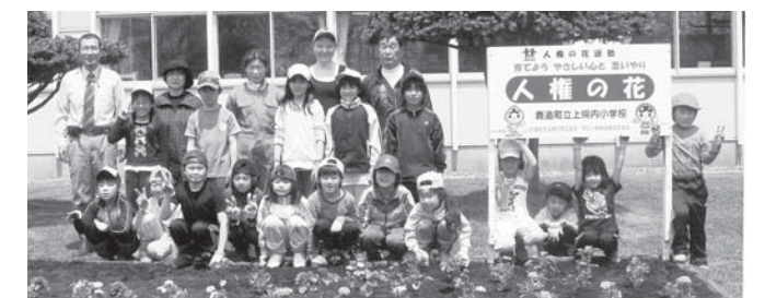
人権の花植栽風景（上幌内小学校）