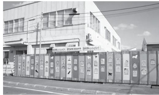
病院仮囲いに展示されている絵

昨年3月に着手し、長く思 えた工期も1年半が過ぎてし まいました。その間町民の皆