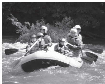
あそび隊 初夏の活動（ラフティング）