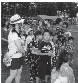
子ども盆踊り大会