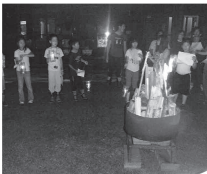
あそび隊 夏の活動（キャンプ）