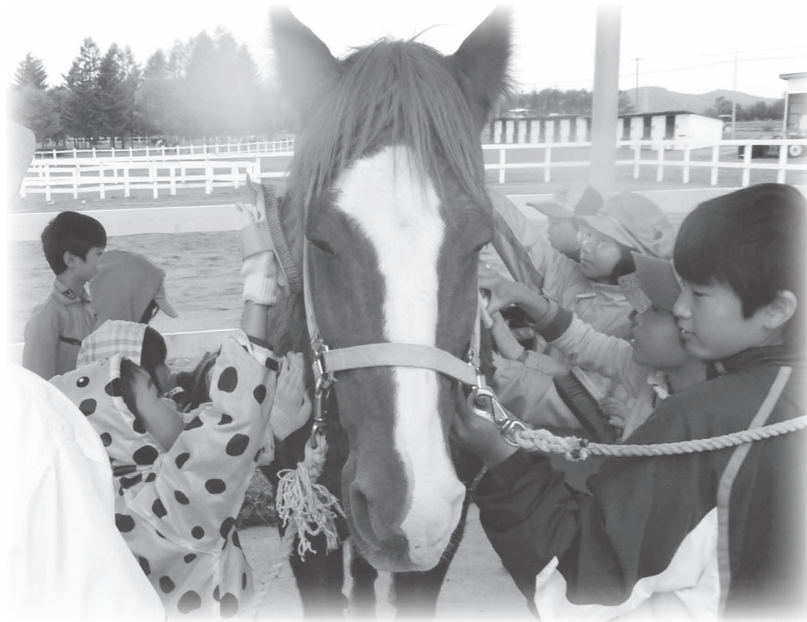
西部十勝ジュニアリーダー研修交流会