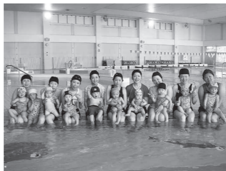
親子ベビースイミング