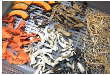
カボチャ・ニンジンなどを干しました

「時短料理ができる」 水分が抜けているため、味がよく染み込み、火の通りが早くなるので短時間で料理が可能になります。また、煮崩れしにくく、カットしてから干すので調理もラクです。