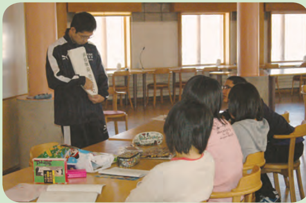
(写真はピュアモルト会館での学習合宿)

1年次より進路意識を育て、2年次で面談や模試データ分析による進路先決定へのアドバイス、3年次での徹底した各教科の指導、集中講座、センター後の進路別講習などが功を奏し、国公立大学9名合格をはじめ、難関私大の突破などめざましい結果を残すことができました。 また、就職も粘り強い取り組みの結果、消防、自衛隊など100%決定することができました。鹿追高校の生徒たちの3年間の努力と先生の努力が実を結んでいることをうれしく思います。