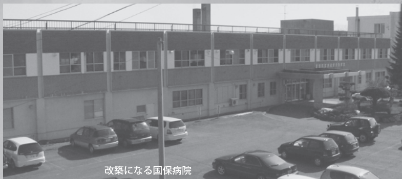
改築になる国保病院