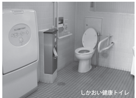
しかおい健康トイレ

健康で快適な生活を送るためには、快適な排せつ(排便)は欠かせないものです。トイレはその国の文化の