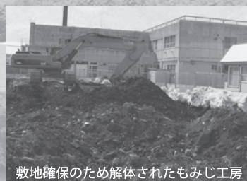
敷地確保のため解体されたもみじ工房

H23年2月には現南棟が解体されると同時に2期増築工事が開始されます。H23年10月から現北棟の1階部分が改修工事されH24年3月に南棟の全部が解体され、外構工事、駐車場も含めH24年7月に工事は完成します。供用開始はH24年8月からとなります。