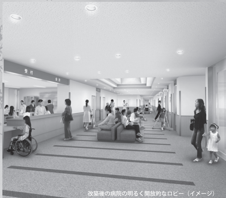
改築後の病院の明るく開放的なロビー (イメージ)