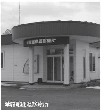
早羅館鹿追診療所

昨年の新型インフルエンザの際には町内の3医療機関が協力してワクチンの接種等を行ってきた。私としては医療連携はかなり出来ていると認識している。今のままで十分機能を果たせるので形成する考えはない。