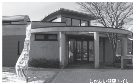
しかおい健康トイレ

1、洋式化については、全てのトイレを洋式化にできませんが、現在の利用頻度を考慮して改善を図ります。鹿追保育園、鹿追小学校、鹿追中学校は22年度中に改善を図ります。2、ウォシュレットの便座については、施設費、メンテナンス等の関係あり各施設の点検を行い改善検討してまいります。3、手すり等については、大事な事なので再点検をし、可能な限り取り付けて参ります。