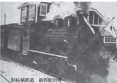
旧拓殖鉄道 新得駅出発

(質問) 鹿追町では歴史的な文化を継承し保存活用を図るため「鹿追町文化財の保護に關