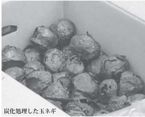
炭化処理した玉ネギ