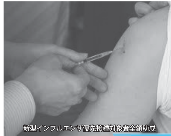
新型インフルエンザ優先接種対象者全額助成