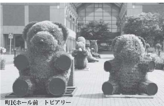
町民ホール前 トビアリー

本町では、平成12年に策定された「鹿追町環境美化宣言」に基づき、平成16年に「環境における基本的なきまり条例」が制定されていますが、この条例に基づ