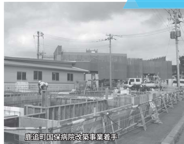
鹿追町国保病院改築事業着手