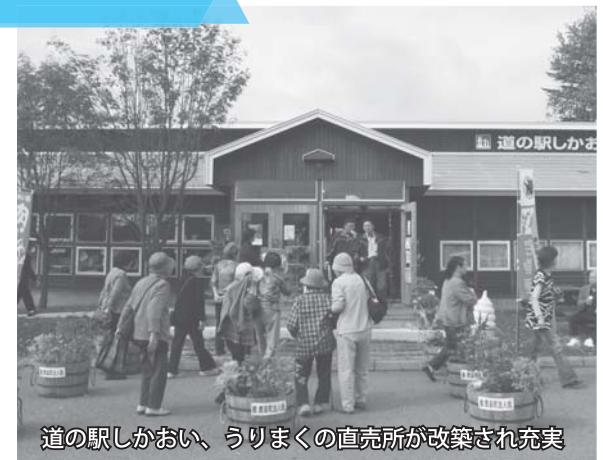
道の駅しかおい、うりまくの直売所が改築され充実