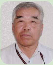
松浦農業委員会会長代理