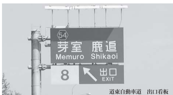
道東自動車道 出口看板