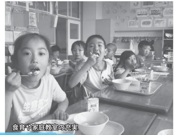
食育や家庭教室の充実