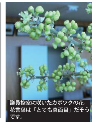
議員控室に咲いたカボツクの花。花言葉は「とても真面目」だそうです。

本ミニ広報は、本会議終了後に発行する年四回の広報誌だけではリアルタイムに伝えられない記事について臨時的に発行しております。そのスタイルを変更しつつ今回で26回目になりました。これからは、「臨時的」からより本格的な編集を目指して、解りやすい、読みやすい、見やすいをモットーに発行して参りますので、より多くの住民の皆さんに読まれますことを願っております。 (川染洋)