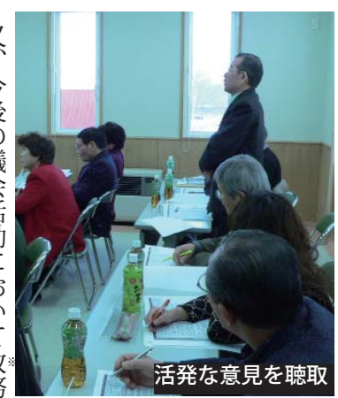
活発な意見を聴取

又、今後の議会活動において政務調査費を交付する事に対し、一層の活動に期待を寄せる貴重な意見を頂きました。