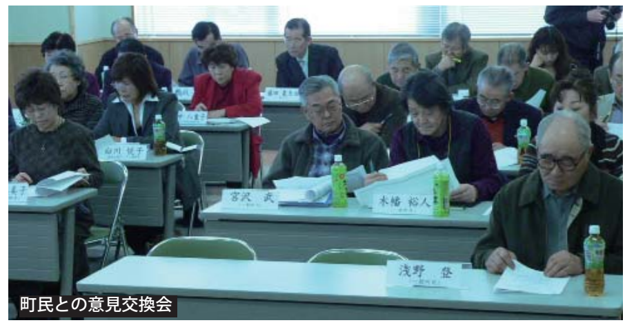
町民との意見交換会

「町民が主権者」である事から、充分な情報の提供と「広聴の機会」を広く持ち、住民からの意見を鹿追町の政策に反映させていく事が重要です。