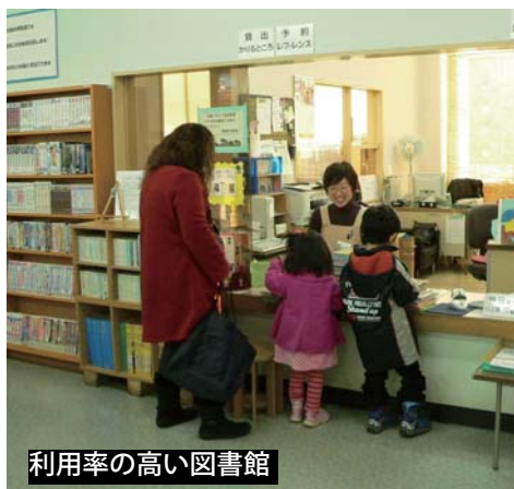
利用率の高い図書館