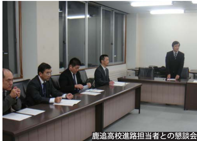
鹿追高校進路担当者との懇談会

○放課後の進学講習 ○夏季・冬季集中的進学講習 ○「鹿ゼミ」講習等 教員によるボランティアの講習が実施され、進学の成果としては20年