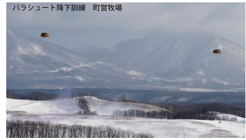
パラシュート降下訓練 町営牧場

又、毎年然別演習場周辺の住民、町内外駐屯地の関係者が一堂に会して懇親を深める「然別のつどい」が