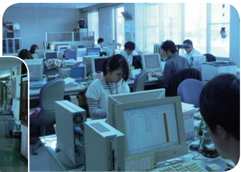
新たに所管に加わった福祉課

子育て支援から高齢者の自立支援までと範囲の広い福祉課、病院増改築事業が進められている町立病院についても、関連する各課との協議も