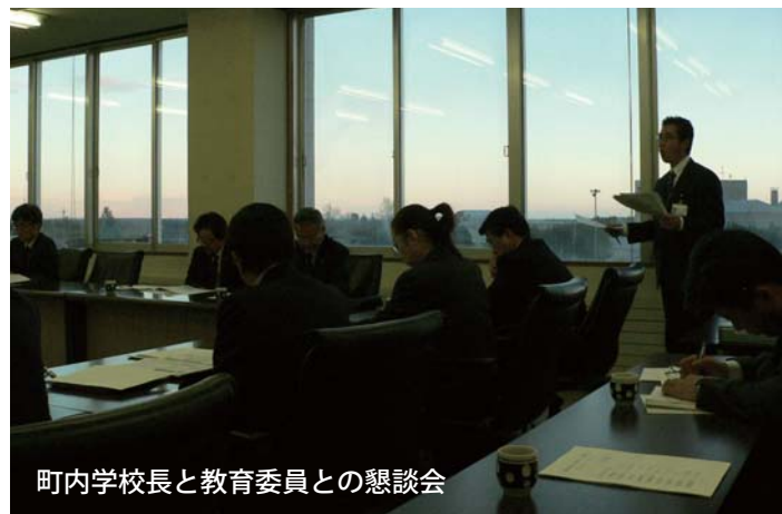
町内小学校長と教育委員との懇談会

教育で、「カナダ学」に加え、「地球学」を実施している報告がありました。各町内学校長からは、創意ある取り組みの現状が報告されました。CRT（標準学力検査）では、本町の英語の学力は全国の平均以上の効果をあげており、今後の小中高一貫の連携により更なる効果が期待されます。