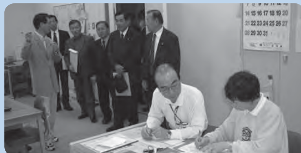
ボランティアガイドも専門的知識を深めるため自己研修。