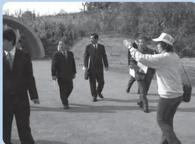
国の史跡、青森市三内丸山では観光ボランティアが大活躍。古代の歴史ロマンをユーモアを交え案内しています。