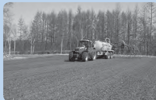
消化液は専用機械で畑に散布されます。