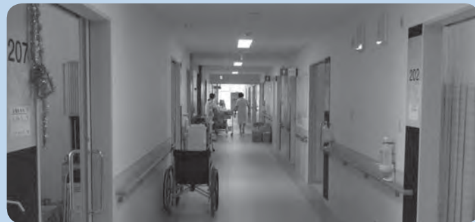
明るく快適な病院です。