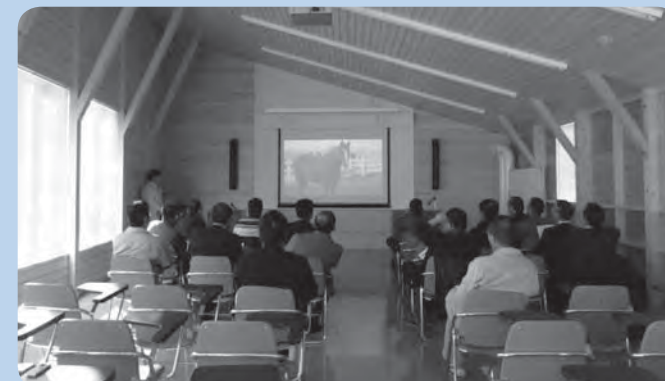
環境保全センター研修棟、最大80人の研修ができます。