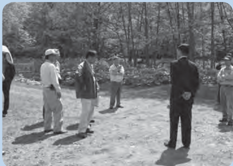
ホテル福原坂本支配人より山田温泉において説明を受ける。