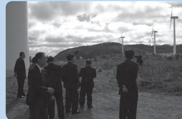
岩手県葛巻町町営牧場に建設された風力発電施設。