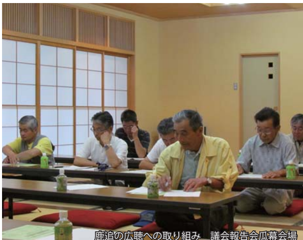
鹿追の広聴への取り組み 議会報告会瓜幕会場