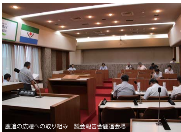
鹿追の広聴への取り組み 議会報告会鹿追会場

鹿追町議会は「議会基本条例」の制定後、町民主体のまちづくりの一翼をになう機関として役割を果たすために、まちなか会議（議会報告会・各種懇談会等）や広報紙を通し、議会活動の周知と町民意向の把握と理解が必要不可欠であることを、先に開催された議会報告会などの取り組み事例を交え説明しました。