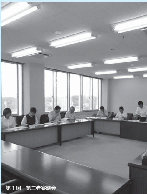
第1回 第三者審議会

反省課題として 今後の取り組みとして、町民の組織団体に気軽に開催の申し込みをしていただけるように呼びかけをするとともに、町民から頂きましたご意見やご提言について、迅速に対応できるよう取り進めます。