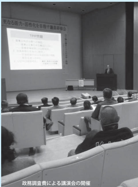
政務調査費による講演会の開催