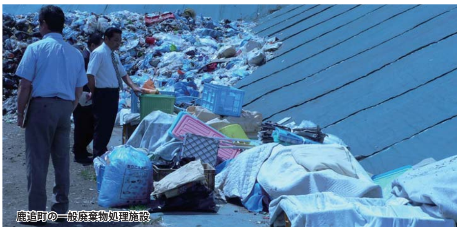
鹿追町の一般廃棄物処理施設

都市部の児童生徒の修学旅行を受け入れ、農村体験を通して町を知ってもらおう取り組みであり、また、農家の所得確保の狙いから、農協、町