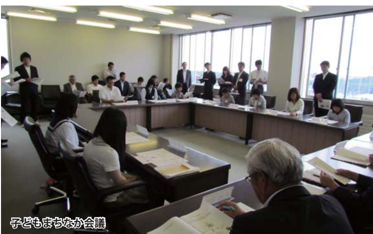
子どもまちなか会議

子ども議員からは、「とても緊張したけど元氣よく質問できました」、「私たちが質問することで、スポー