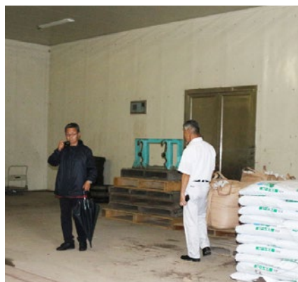
氷室 以前は大量の氷を利用し、じゃがいもを低温貯蔵していた

農協から取得後、施設改修と周辺整備が行われてきた。氷室、旧馬鹿牧場は共に利用事業者の撤退があり、現在氷室は倉庫として利用している。旧馬鹿牧場は整備されている。