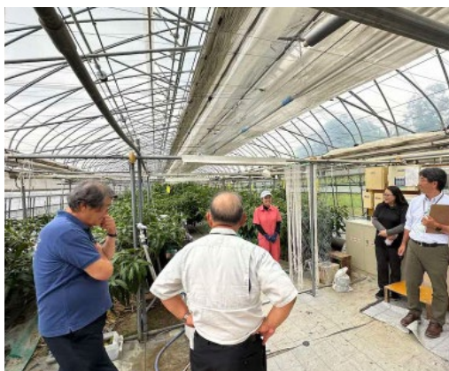
マンゴー栽培ハウス 順調に生育し収穫が期待される

農村青年が主として事業を行っていたが、事業形態が変わっている。町民の理解を得るためにも現状と将来像を示す必要がある。