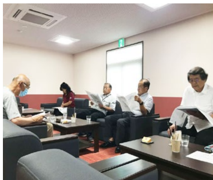
鹿追会場の平成館では1人が参加