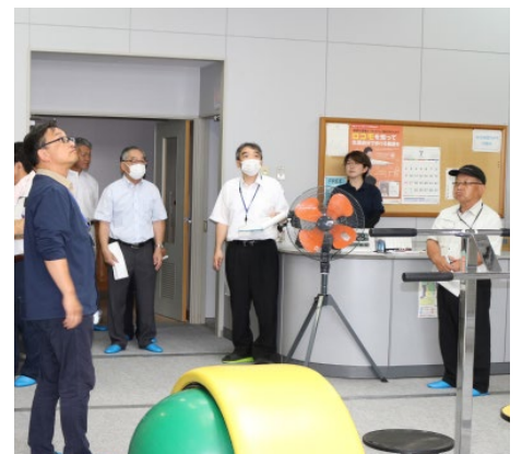
トリムセンターフィットネス室 主に健康維持・増進のために利用されている

フィットネス室の利用者数や状況を確認した。空調を整備する等、夏季の室温管理が必要である。