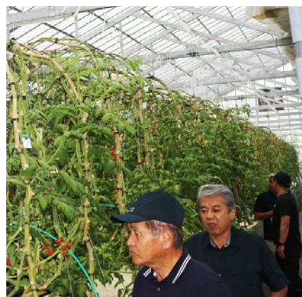
瓜幕余剰利用ハウス 今後就労支援B型事業所の利用者が作業する予定

新たに福祉事業所による利用計画があることから、福祉的配慮のある休憩室とトイレが必要である。