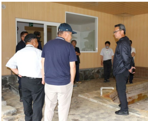
山田温泉浴室 利活用や今後の方向性について検討が必要

一部改修工事が行われているため経過を見ていくが、将来的には当施設の利活用や今後の展開について、有識者を交えた検討委員会の設置を考える必要がある。