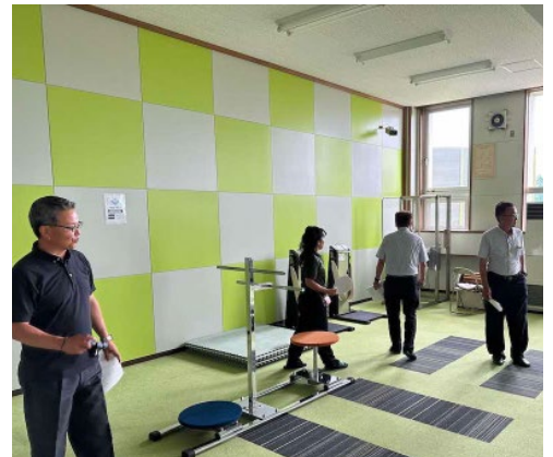
スポーツセンタートレーニング室 主に筋力強化のために利用されている

トレーニング室の主な利用者は各スポーツ団体で、スタッフ未配置のため安全性に配慮することが必要である。設置から数十年経過したもので使用不能な器具があるため、適正な時期に更新する必要がある。