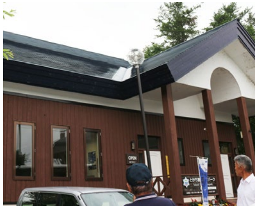
ジオパークビジターセンター 雨漏りしていた天窓を取り外し修繕した

施設の整備・改修が行われたことから現場の施設状況を調査した。 天窓を取り外し、研修棟の外壁塗装も施され整備されている。