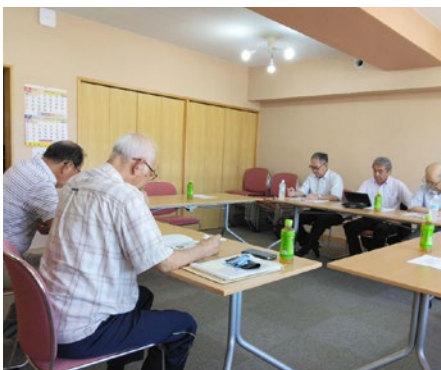
瓜幕会場のウリマックホールでは2人が参加