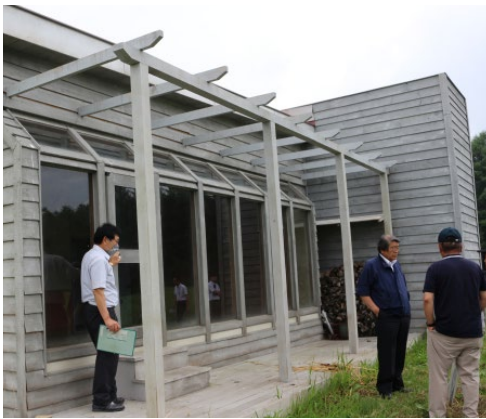
映画「おしゃべりな写真館」ロケセット

町内で撮影された映画「おしゃべりな写真館」ロケセットの観光資源活用について調査した。 基礎のない簡易的な構造のため、維持管理は難しい。