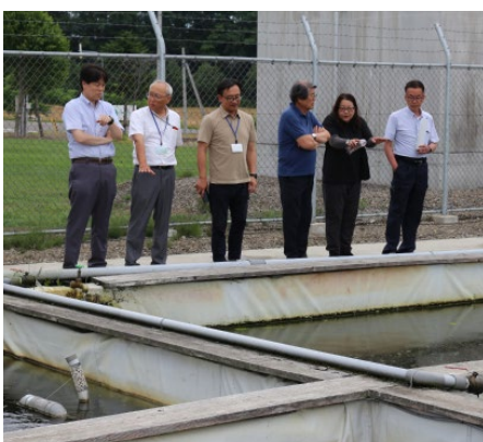
チョウザメ館屋外水槽 順調に養殖が行われている

町民からチョウザメに関する質問があることから、町民へのさらなる説明が必要である。