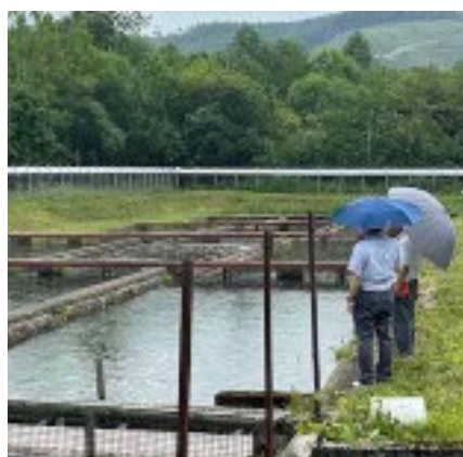
旧岩松養魚場 チョウザメとニジマスを養殖している

河川からの土砂流入が見受けられ、今後その排出に対応する必要がある。現状維持で問題はないが、定期的な管理計画が必要がある。