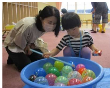
何色にしようかな…