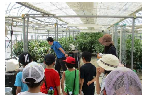
マンゴーの収穫時期は 12月頃から