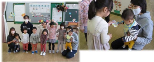
通明保育所のお友達と!