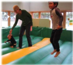
トランポリンの日