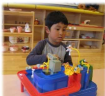
トーマスの遊具が大人気