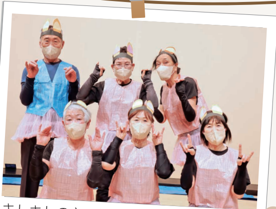
キレイのきつねダンスを披露 12月23日 ヌブカウシ白寿大学祭