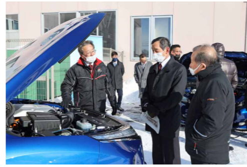
自営線ネットワークの余剰電力で充電を行いゼロカーボンを推進していきます

今後、PHEV車は災害対応車両として、EV車は非常時や各種行事の電源確保においても活用される予定です。