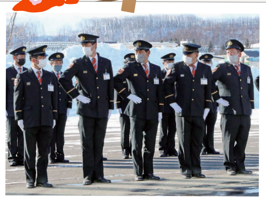
今年も地域の安全を守ります 1月6日 鹿追消防団 出初式