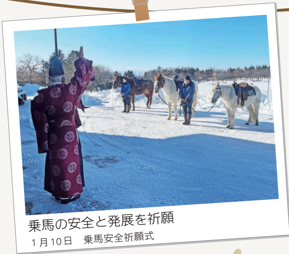
乗馬の安全と発展を祈願 1月10日 乗馬安全祈願式