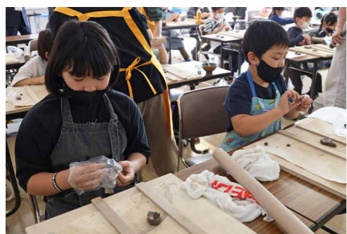
参加者は、少しずつ変化を加えながら個性あふれる作品に仕上げました

参加者は、「上手には作れなかったけど、楽しんで作れた」「たくさん作れたので、お客さんが来た時などに使いたい」と話していました。