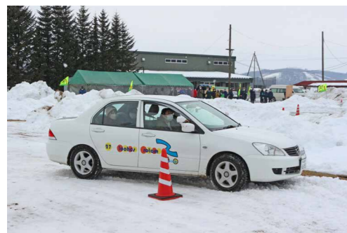
カラーコーンを避けながら慎重にスラロームを行う参加者

技術指導員のアドバイスを受けながら、冬道での運転操作を再確認する機会となりました。