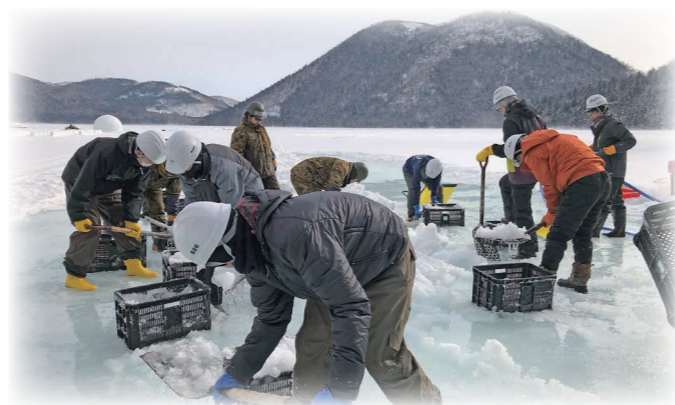
しかりべつ湖コタン開村間近 42回目の出現準備は順調

試食会では、鹿追町産マンゴー、鹿追高校生が開発したじゃがいもアイスやホイップも提供されました。