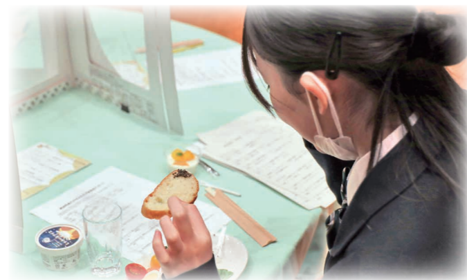
商品化への第一歩 鹿追町産キャビア試食会を開催

13日は保護者、14日は1、2年生を対象に行われ、安心、自信、自由の大切な3つの権利があり、暴力にあったときにNO（いやー）、GO（場を離れる）、TELL（誰かに相談する）ができるよう練習しました。