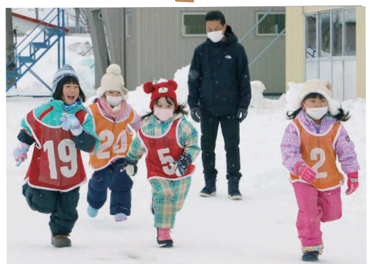
町民スケート大会に向けて猛特訓 1月14日 初心者スケート教室