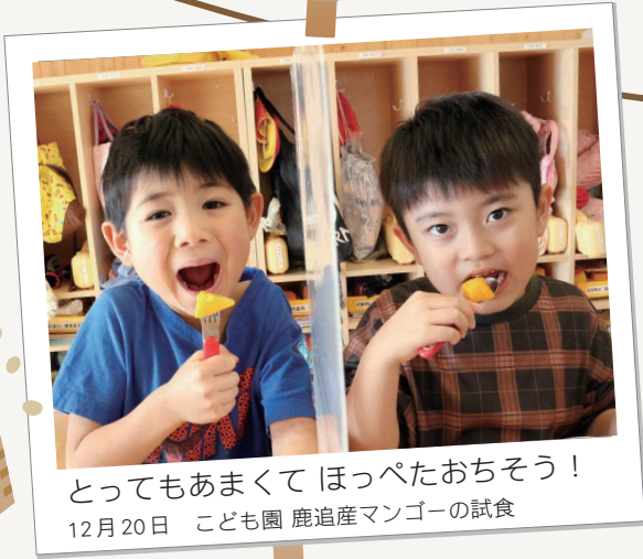
とってもあまくてほっぺたおちそう! 12月20日 こども園 鹿追産マンゴーの試食