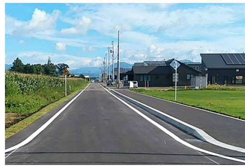
道路整備が行われた「いずみ野団地」の車道と歩道