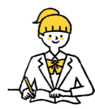
職員採用試験説明会 申込