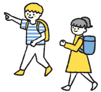
国際青少年研修協会 HP