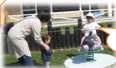
こうやって のるんだよ!