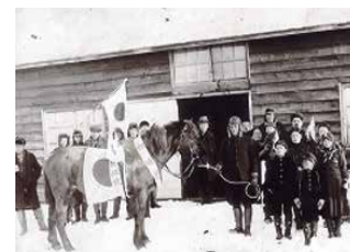
状況を察知した馬の目に涙