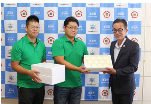
アイスクリームを喜井町長 (右) に手渡す林副部長 (左) と小森副部長 (中央)