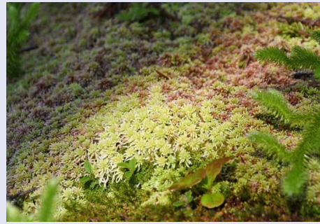
スギバミズゴケの群落

然別湖周辺の山々では、登山道沿いに昔の森を楽しむことができず。特に風穴周辺でコケの群落となっている場所があります。観察しやすいのは駒止湖探勝路、東ヌブカウシヌプリ山や東雲湖への登山道です。実は、然別湖周辺の風穴地帯と東雲湖は、「日本の貴重なコケの森」として選定されています。これは日本蕨苔類学会が選定するもので、多種多様なコケ類が見られ美しい景観となっていることが評価されました。