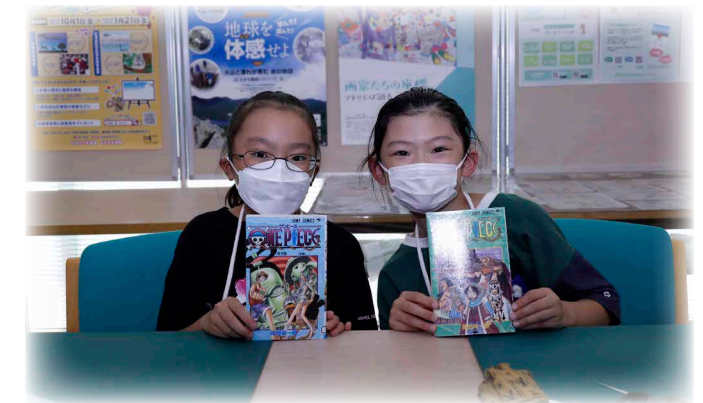
大好きな本に囲まれてお仕事 小学生が図書館で1日司書体験

8月3日から5日まで、「小中学生夏休み学習サポート」(町教委主催)が、町民ホール2階に新設された公設塾専用スペース「ペンギンコロニー」で行われ、3日間で小学生延べ21人と中学生延べ17人が参加しました。この事業は、地域全体で学校活動をサポートする地域学校協働活動事業の初めての取り組みとして実施。午前中は小学生が、午後からは中学生がそれぞれ夏休みの学習課題に取り組みました。小学生のサポートは鹿追高校生で、学習サポートボランティアとして7人の生徒が手を挙げました。中学生は現役大学生2人と鹿追高校教員4人が指導を行い、鹿追高校の全面協力により子供たちの学習活動の充実が図られました。