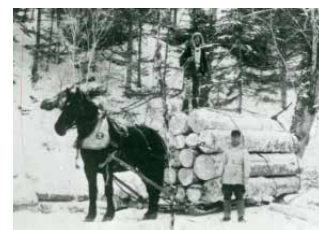
冬は馬そりで運搬