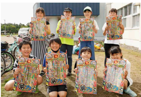
寄贈された花火を笑顔で手にする鹿追小学校の児童たち