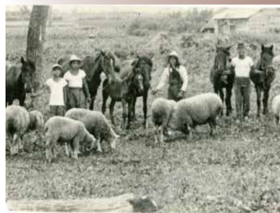
家畜は家族の一員として愛情を注いでいた

家畜感謝之碑建立期成会は、次の団体が参加しています。 鹿追町 鹿追町農業協同組合 鹿追町農業委員会 鹿追町農業共済組合 鹿追町酪農振興会 鹿追町養豚組合 鹿追町養鶏組合 鹿追町馬事振興会 十勝家畜商業組合鹿追支部