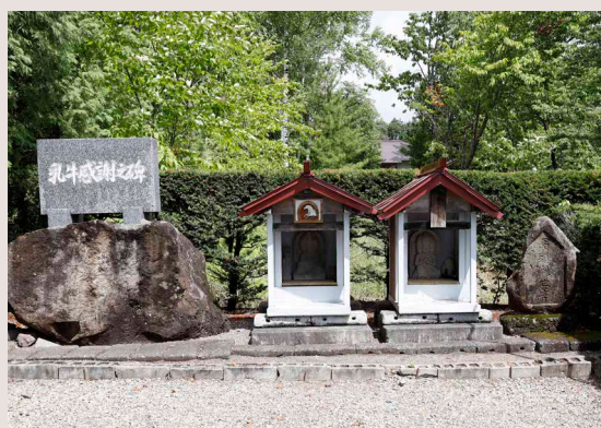
乳牛感謝之碑と馬頭さん

東瓜幕に「乳牛感謝之碑」が建立されたのは昭和50年7月です。地域の乳牛を飼育する農家に「碑」の建立について次の一文が残されていました。