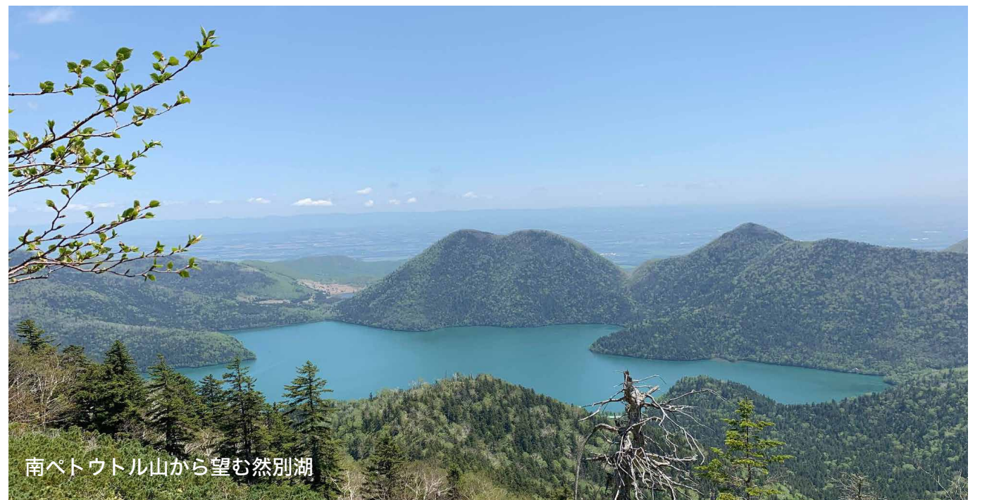
南ベトル山から望む然別湖

南部 私も自然の中に行くことが好きです。野外炊飯やキャンプファイヤーをしたり。今年は日高青少年自然の家でカレーをつくりました。