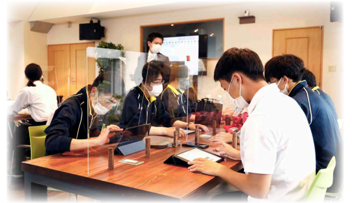
持ち運べるオンラインの公設塾 専用の学習スペースがオープン

鹿追高校の生徒を対象とした「オンライン公設塾」の学習スペースとして、7月12日から町民ホール内に「ペンギン・コロニー」がオープンしました。 群れから最初に海に飛び込むファーストペンギンのように社会の波に果敢に飛び込んで欲しいという願いが込められたペンギンコロニー。この学習スペースで展開される同塾ではICTを活用し、札幌や東京の学生指導員から学習指導を受けられます。自宅や学校など場所を問わず受講できる一方、集中できる勉強場所の確保、町外から通う生徒の下校のバスの待ち時間の利活用のため今回の開設に至りました。早速鹿追高生が同スペースで勉学に励んでいます。