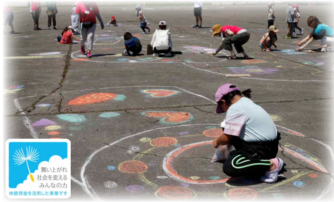
消防署の駐車場にチョークアート 子供たちの力作で大きなケーキ現る

7月17日、鹿追消防署において「ここから実験室」(NPO法人かしわのもり主催)の7月開催のイベントが行われました。 「ここから実験室」は、子供たちがこの活動を通じ、感性や素直な感情を認め合う関係性を育んでもらおうと年7回の開催を予定しています。この日行われた「チョコレートin消防署」には、年長から小学3年生までの24人が参加。消防署の駐車場いっぱいに描かれた大きなケーキのスポンジをデコレーションし、色とりどりのチョコクッキーを使い果物などのトッピングをしました。最後は手作り炎をケーキに描かれたロケットに点火。そして消防職員との放水遊び。毎年最高に盛り上がる恒例的一幕です。