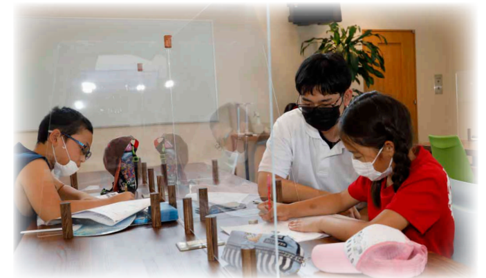
教えてくれるのは町の先輩 小中学生夏休み学習サポート

8月3日から5日まで、「小中学生夏休み学習サポート」(町教委主催)が、町民ホール2階に新設された公設塾専用スペース「ペンギンコロニー」で行われ、3日間で小学生延べ21人と中学生延べ17人が参加しました。この事業は、地域全体で学校活動をサポートする地域学校協働活動事業の初めての取り組みとして実施。午前中は小学生が、午後からは中学生がそれぞれ夏休みの学習課題に取り組みました。小学生のサポートは鹿追高校生で、学習サポートボランティアとして7人の生徒が手を挙げました。中学生は現役大学生2人と鹿追高校教員4人が指導を行い、鹿追高校の全面協力により子供たちの学習活動の充実が図られました。