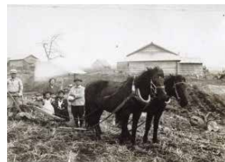
ブラオで畑起こし