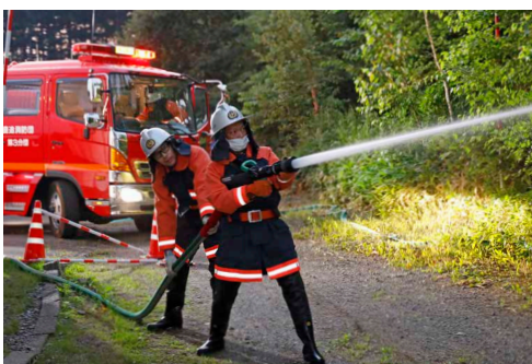
暗所での現場活動は安全管理が重要。実践的な訓練で町民の安全を守ります